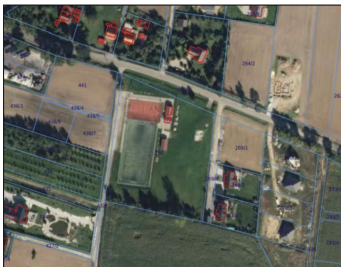
Rys.1. Obecny sposób użytkowania terenu

Obecnie na omawianym terenie zlokalizowana są obiekty sportu i rekreacji.